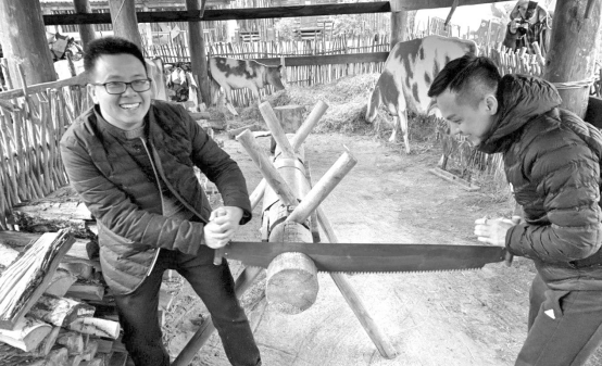
Гости из КНР на практике познакомилась не только с инфраструктурой поддержки бизнеса в Тюмени, но и с местной экзотикой.

В Тюмени в рамках первого этапа проекта «Российско-Китайский молодежный бизнес-инкубатор» большая группа молодых предпринимателей из Гуанчжоу посетит местные предприятия, инновационный и медицинский центры, детский технопарк и индустриальные парки, встретается с представителями профильных подразделений муниципалитета и региона, знакомится с достопримечательностями сибирского города и его окрестностей. Принимающие организации — Российский Союз Молодежи, отделение «Опоры России» и Тюменский индустриальный университет — подготовили для гостей насыщенную культурную программу. Готовятся к подписанию ряд соглашений о сотрудничестве, в том числе между бизнес-инкубатором Тюменского технопарка и двумя самыми крупными аналогичными организациями Гуанчжоу. В октябре тюменцы нанесут ответный 10-дневный визит. Международный бизнес-инкубатор направлен на вывод действующих российских проектов, а также стартапов на рынок Поднебесной, привлечение китайских инвестиций в отечественную экономику.