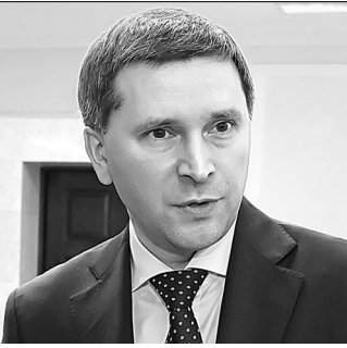
Дмитрий Кобылкин, министр природных ресурсов и экологии РФ:

Первые шаги делает и Челябинская область, здесь в работу включились промышленные гиганты: десять крупнейших предприятий столицы Южного Урала и шесть магнитогорских заводов. В обоих городах стартовала рекультивация свалок, заработали два поста контроля качества атмосферного воздуха. А в недалеком будущем в регионе появится единая система мониторинга выбросов. ●