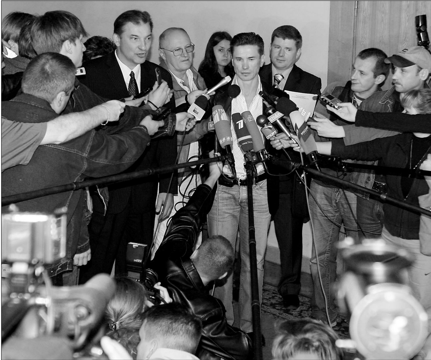
Вчера. Москва. Олимпийский комитет России. Президент ФХР Владислав ТРЕТЬЯК и новый главный тренер сборной Вячеслав БЫКОВ в кольце репортеров.