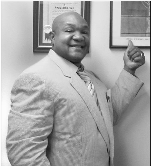
Июль. Хьюстон. Джордж ФОРМЭН.

И вот, лежу у подножия. Чтобы полицейские собаки меня не нашли, вымазался с ног до головы какой-то гадостью, которая там была. Может, трубу где-то прорвало... И слышу в голове голос двоюродной сестры. Мне 16 лет, а впереди - ничто. Я никогда никем не стану. Вот тогда