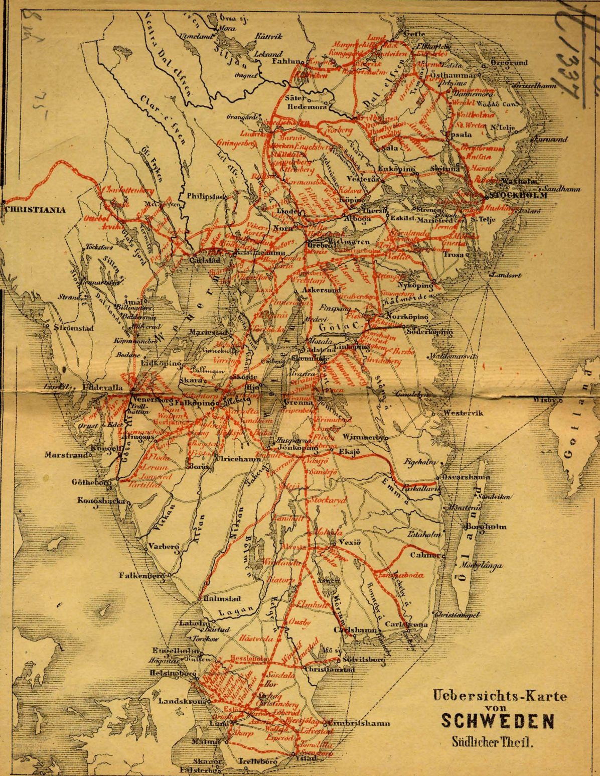
Uebersichts-Karte von SCHWEDEN Südlicher Theil.