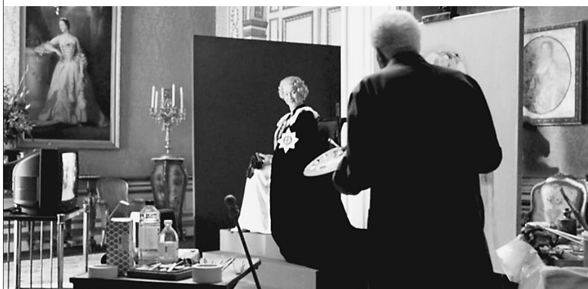
Королевскую статью Хелен Миррен обязана своим русским аристократическим корням

побед в войнах с турками, дававших России выход к Черному морю, дослужился до генерал-фельдмаршала, получил графский титул и должность генерал-губернатора Петербурга. 16 ноября 1806 года Александр I назначает его главнокомандующим русскими армиями. → стр. 10