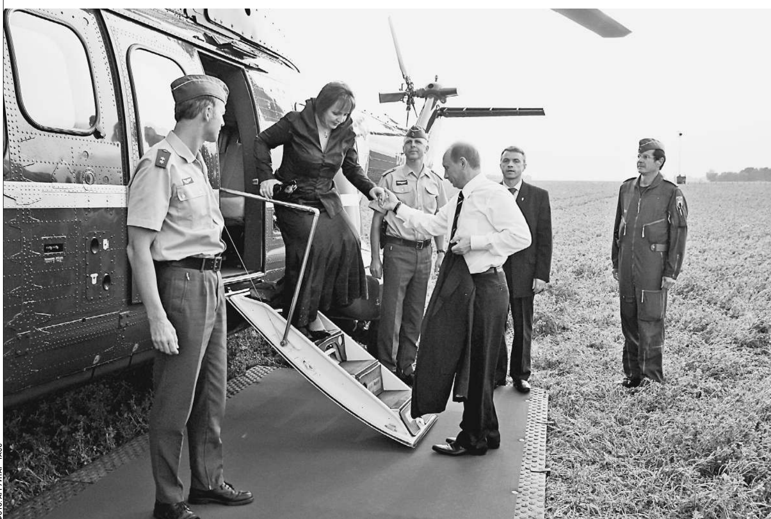
Владимир и Людмила Путины, как и другие участники саммита, прибыли в Хайлигендамм на вертолете