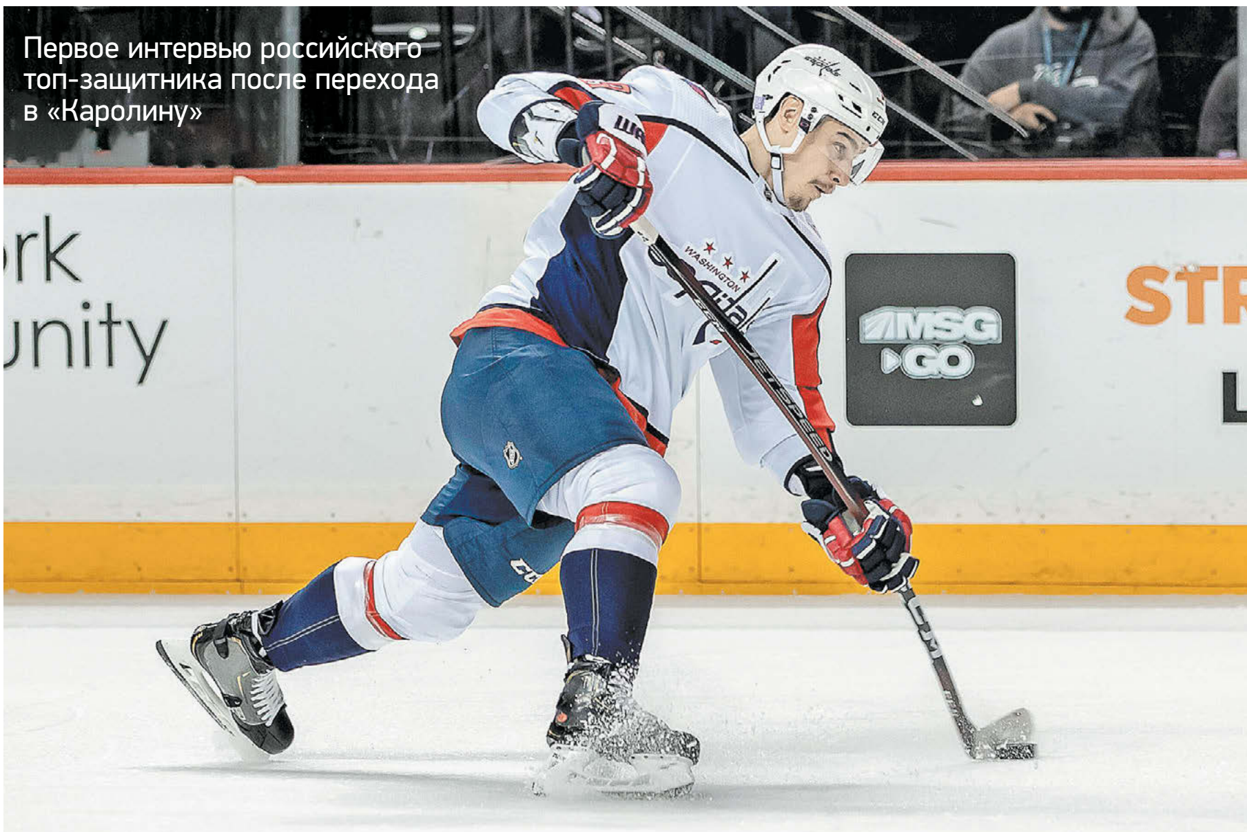
Дмитрий Орлов в игре за «Вашингтон»

Первое интервью российского топ-защитника после перехода в «Каролину»