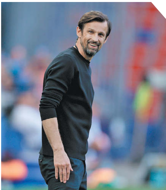
Дарья Исаева «СЭ»

В котором главный тренер «Зенита» объяснил, с какими сложностями сталкиваются чемпионы России в селекционной работе