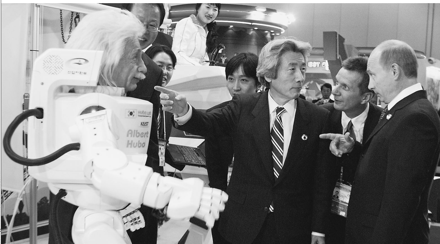
На выставке высоких технологий в Южной Корее лидерам России (справа) и Японии (в центре) пригласился робот «Эйнштейн»

В ходе азиатского турне Владимир Путин получает подарки со смыслом