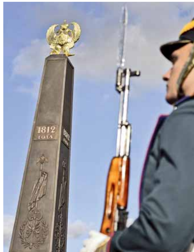
Солдат Президентского полка на торжественной церемонии открытия памятника новгородскому народному ополчению в Отечественной войне 1812 года.