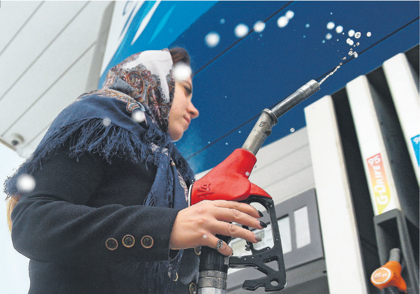
Внутреннего потребления бензина может оказаться недостаточно для поддержания нефтепереработки на высоком уровне

По данным Reuters, с 15 по 19 января российские НПЗ нарастили объем переработки