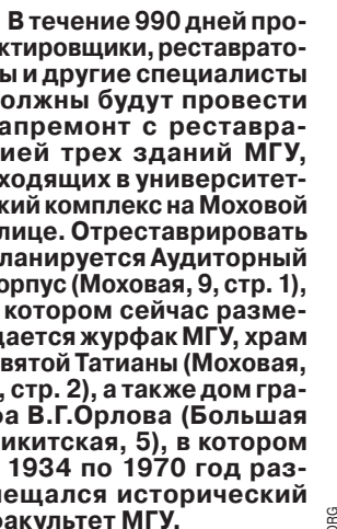
В течение 990 дней проектирования, реставрации и другие специалисты должны будут провести капремонт с реставрацией трех зданий МГУ, входящих в университетский комплекс на Моховой улице. Отреставрировать планируется Аудиторный корпус (Моховая, 9, стр. 1), в котором сейчас размещается журфак МГУ, храм Святой Татианы (Моховая, 9, стр. 2), а также дом графа В.Г. Орлова (Большая Никитская, 5), в котором с 1934 по 1970 год размещался исторический факультет МГУ.

Реставрация коснется в первую очередь интерьеров зданий. В частности, планируется воссоздать лепной и художественный декор, деревянные панели интерьеров, двери и проемы, историческую стационарную мебель, а также исторические люстры и другие осветительные приборы. Кроме того, планируется отреставрировать (или воссоздать по результатам