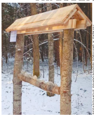
68 солонок для копытных установили специалисты Департамента природопользования и охраны окружающей среды в Новой Москве.

Как узнал «МК», гигантские солонки, предназначенные специально для лесной и копытной фауны, появились в лесохозяйственной службе в Новой Москве.