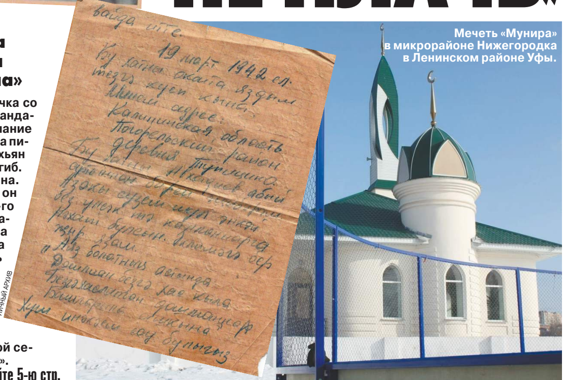
Мечеть «Мунира» в микрорайоне Нижегородка в Ленинском районе Уфы.