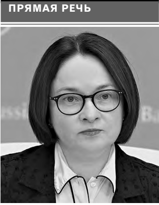
Эльвира Набиуллина, председатель ЦБ РФ:

По мнению экономиста, такая ситуация приводит к тому, что преимущества имеют компании, обладающие выходом на конечных потребителей. Напротив, высокотехнологичные предприятия, действующие в сложных кооперационных цепочках, в значительной мере отрезаны от доступа к деньгам. ●