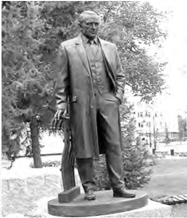
Памятник знаменитому земляку установили рядом с Омским театром драмы.

В сквере Омского театра драмы установили памятник народному артисту СССР Михаилу Ульянову. Место выбрано неслучайно. Здесь он обучался в театральной студии. Сюда в годы Великой Отечественной был эвакуирован из столицы театр имени Е. Б. Вахтангова, в котором впоследствии, начиная с 1950 года, работал талантливый сибиряк. Этого события общественность ждала два года. Символический камень на месте будущего монумента заложили еще 30 мая 2016 года. В торжественной церемонии участвовала Елена Ульянова — дочь артиста. Создание памятника поручили народному художнику России Салавату Шербакову. Работая над ним, мастер советовался с дочерью Ульянова. Ему было важно, чтобы скульптура получилась реалистичной, с портретным сходством и настроением. Монумент вышел внушительным. — Вес бронзовой фигуры — 850 килограммов, а с постаментом —