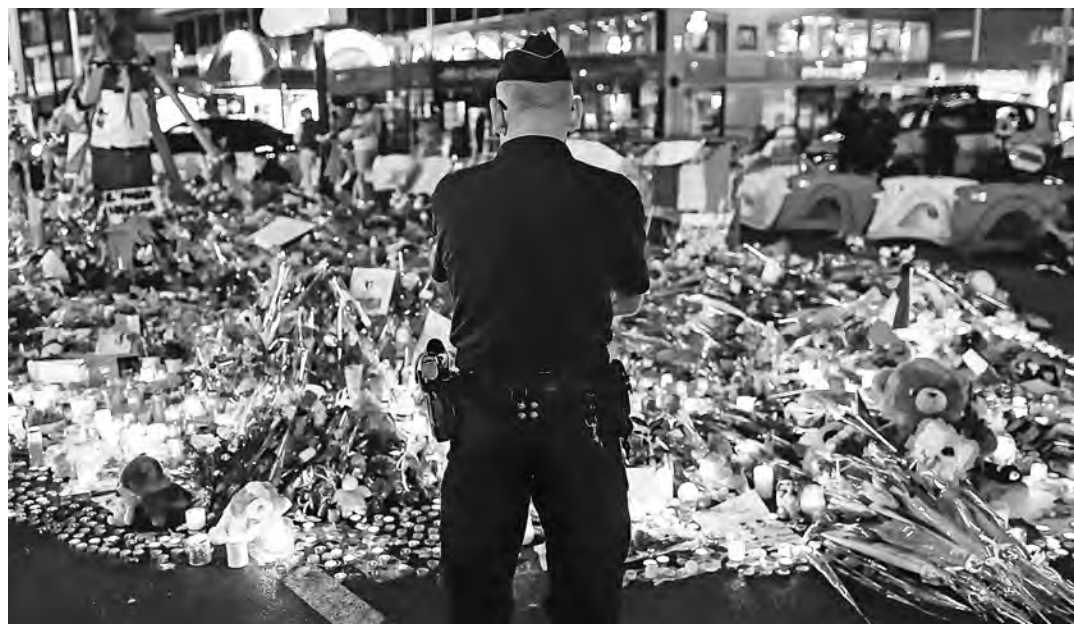
Жители Ниццы заполнили Английскую набережную морем цветов и свечей в память о жертвах теракта.

Ницца в трауре, а вместе с ней вся Франция. Знаменитая Английская набережная, дугой опоясывающая залив Ангелов, теперь в сознании горожан и тех, кто любил сюда приезжать на отдых под ласковым средиземноморским солнцем, навсегда будет связана с произошедшей здесь трагедией. В четверг поздно вечером, когда после праздничного фейерверка по случаю Дня Бастилии десятки тысяч местных жителей и туристов стали расходиться, на набережную выкатил белый 19-тонный фургон-рефрижератор. Сняв установленные полицией металлические барьеры, отгородившие прогулочную зону, и набирая скорость, фургон рванул вперед, давя людей, разбра-