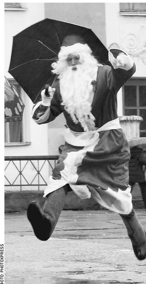
СЦЕНАРИЙ ТРЕТИЙ, ЭКОЛОГИЧЕСКИЙ

Если у вас наполеоновские планы на будущее, будьте начеку. Уже в следующем году в мире может появиться новый вирус страшнее птичьего гриппа. Одна успешная атака террористов приведет к тому, что миром будет править нефтяной альянс ChavRes во главе с президентом Венесуэлы Уго Чавесом. Думаете, это все из сценария новой голливудской антиутопии? Нет. Лучшие экономисты соберутся сегодня в Давосе на Всемирный экономический форум, чтобы обсудить эти страшные сценарии нашего будущего.