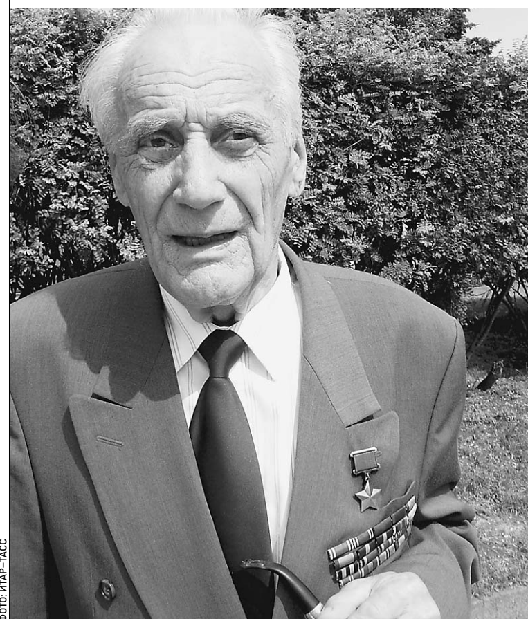
Кто он, Арнольд Мери: герой войны или оккупант?

ветские войска. Об этом «Известиям» рассказал участник освобождения столицы Арнольд Мери. Он единственный ныне живущий эстонец — Герой Советского Союза. Кроме того, он — двоюродный брат бывшего президента Леннарта Мери. Того самого, который до конца своих дней был убежден, что Советский Союз Эстонию не освободил, а оккупировал. → стр. 4