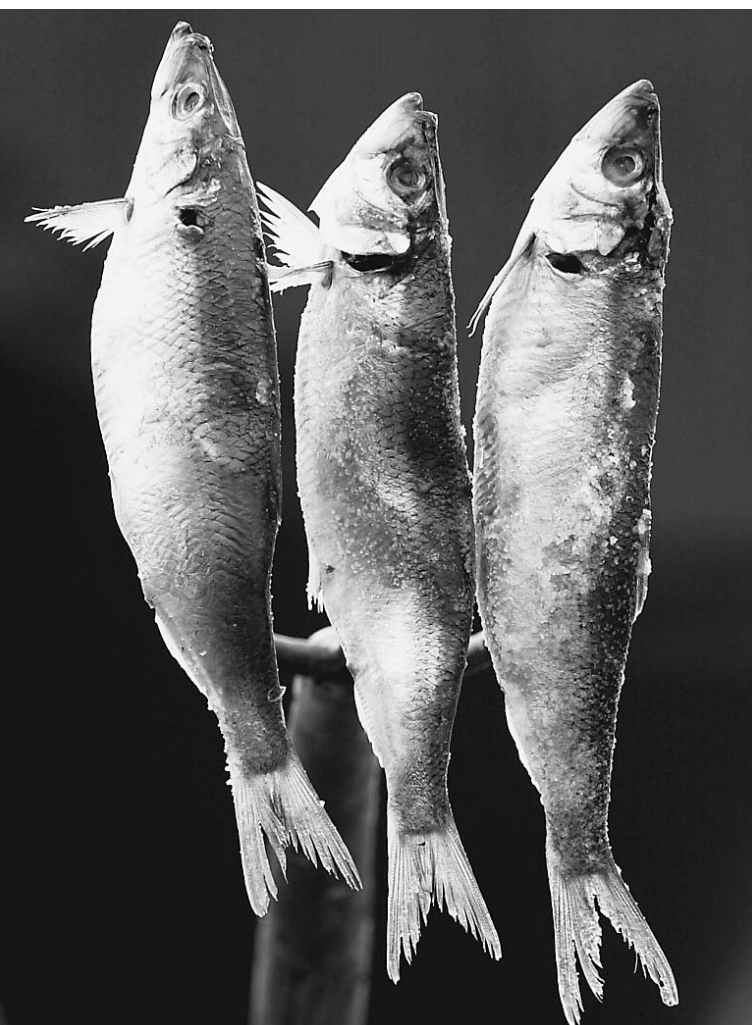
Любимая закуска россиян скоро станет доступнее

Что-то необычное творится в последнее время с нашим национальным «продуктовым дуэтом» — водкой и селедкой. «Беленькую» россияне по-прежнему уважают. Но чиновники подсчитали, что в прошлом году мы выпили ее на 10% меньше. С чего бы это? Селедку мы меньше есть не стали. Вот только нашу рыбку в магазинах часто не увидишь. Сплошь импортная, дорогая. Куда наша девается? Тем более что с этого января Россия вылавливает на треть больше селедки, чем раньше. По идее любимая национальная закуска должна подешеветь.