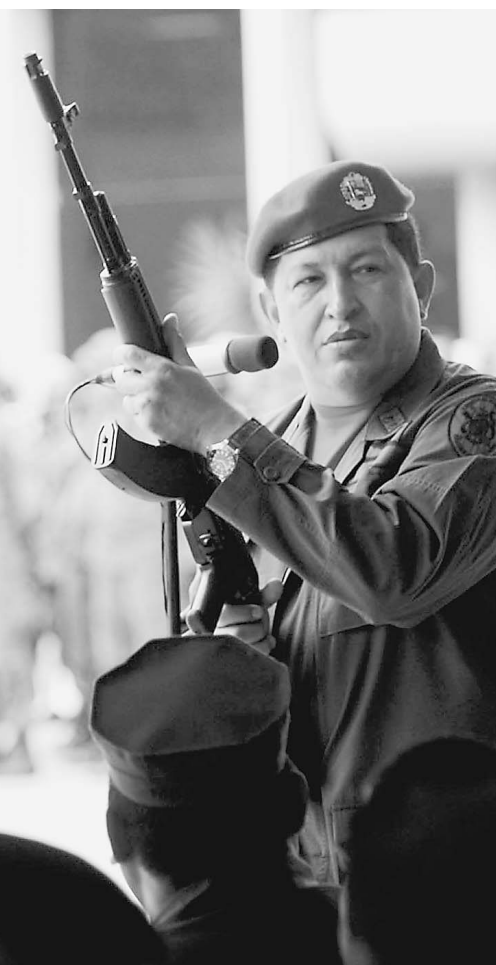
СЦЕНАРИЙ ПЕРВЫЙ, ТЕРРОРИСТИЧЕСКИЙ

Всемирный экономический форум нарисовал мрачное будущее всего человечества