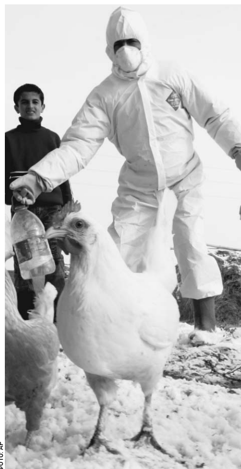
СЦЕНАРИЙ ВТОРОЙ, ЭПИДЕМИЧЕСКИЙ