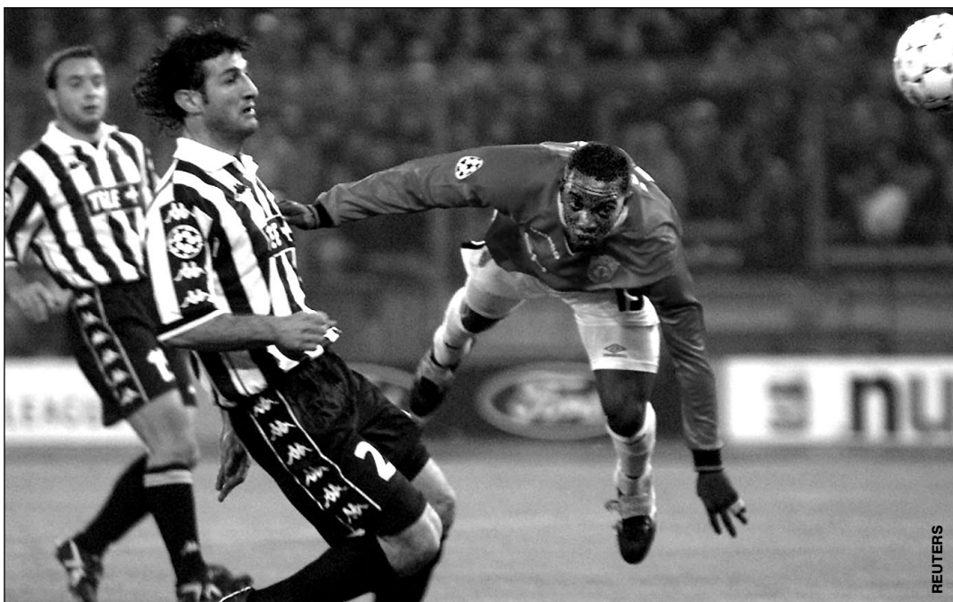
Среда. Турин. «Ювентус» - «МЮ» - 2:3. Дуайт ЙОРК забивает в ворота хозяев второй гол, оказавшийся в итоге решающим.