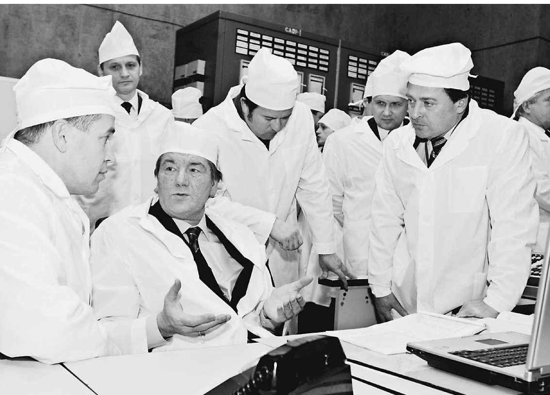
Посетив Чернобыль, президент Украины решил его возродить

Президент Украины Виктор Ющенко решил вновь заселить опустевшие районы вокруг Чернобыльской АЭС. Для начала он поручил главе администрации Киевской области легализовать так называемых самоселов — стариков, «незаконно» переехавших в окрестности Чернобыля. Сегодня их насчитывается 300 человек. В 2006 году эти люди получат официальную регистрацию. Так Украина отметит 20-летие чернобыльской катастрофы. → стр. 3