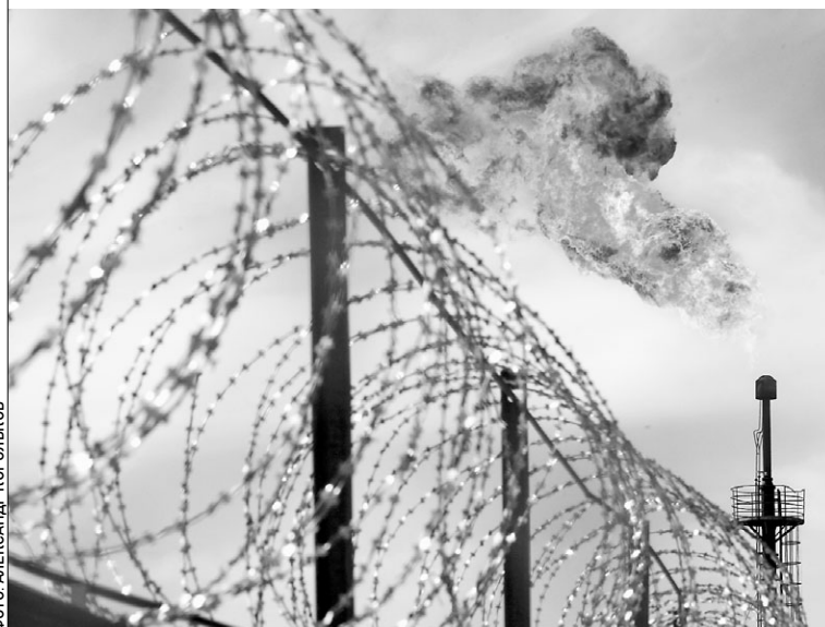
Газ чуть не поспорил Украину с Россией

вами государств. Президенту Владимиру Путину недавно пришлось подробно в прямом эфире рассказывать стране, сколько потеряет отечественный бюджет, если «Газпром» и дальше будет дотировать экономику Украины по льготным ценам. → стр. 7