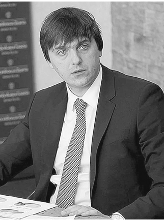
Сергей Кравцов, министр просвещения РФ

Главный ведомства пообещал также всестороннее содействие в создании центра федерального строительного контроля Омской области. ●