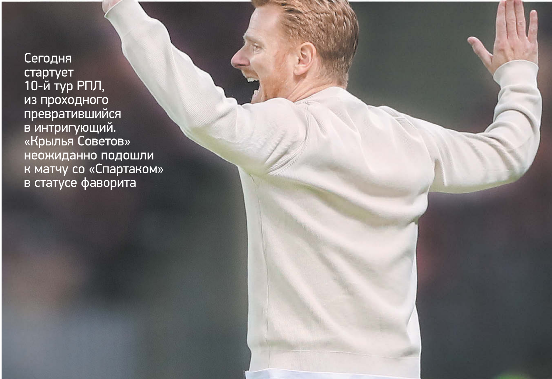
Главный тренер «Спартак» Гильермо Абаскаль

Сегодня стартует 10-й тур РПЛ, из проходного превратившийся в интригующий. «Крылья Советов» неожиданно подошли к матчу со «Спартак» в статусе фаворита