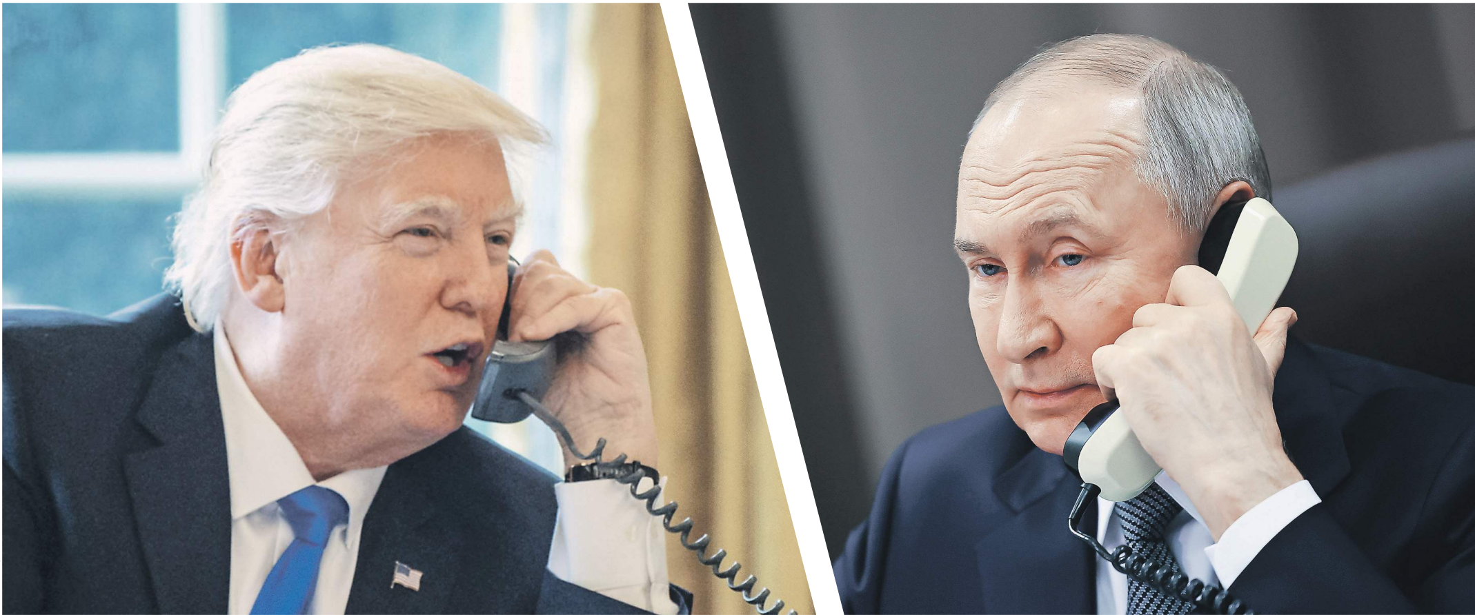
Телефонный разговор между Владимиром Путиным и Дональдом Трампом продлился более двух часов

Путин и Трамп договорились совместно прорабатывать урегулирование на Украине — что еще обсудили лидеры России и США