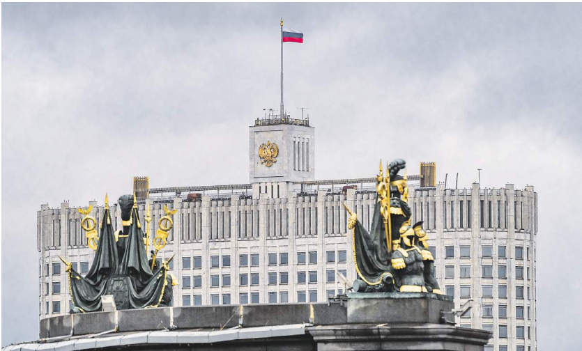
Константин Кошкин / Известия

Правительство отменило почти все нормативные акты, ухудшающие бизнес-климат