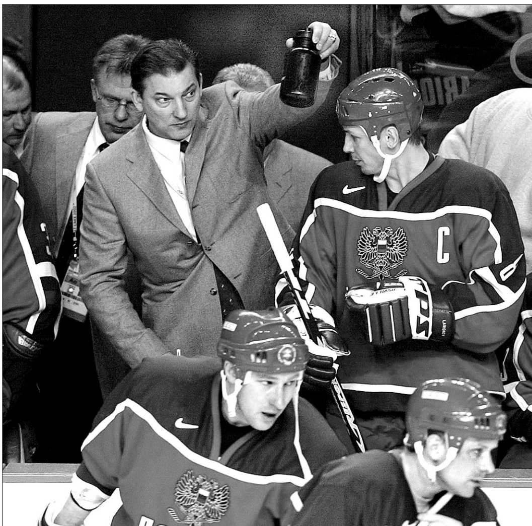
2002 год. Солт-Лейк-Сити. На этой Олимпиаде, где Россия завоевала бронзовые медали, Владислав ТРЕТЬЯК работал в нашей сборной тренером вратарей.

Почти сразу получил предложение уехать играть в «Монреаль». Давали один из лучших контрактов по тем временам. Но в Канаду меня не отпустили. Как потом узнал, в Москву дважды приезжали менеджеры клуба, но им сказали, что у меня папа - большой военачальник (действительно, такой военачальник, мой одноклассник, служил тогда в Дальневосточном округе) и что, мол, я сам никогда не хочу уезжать, чтобы папу не расстраивать.