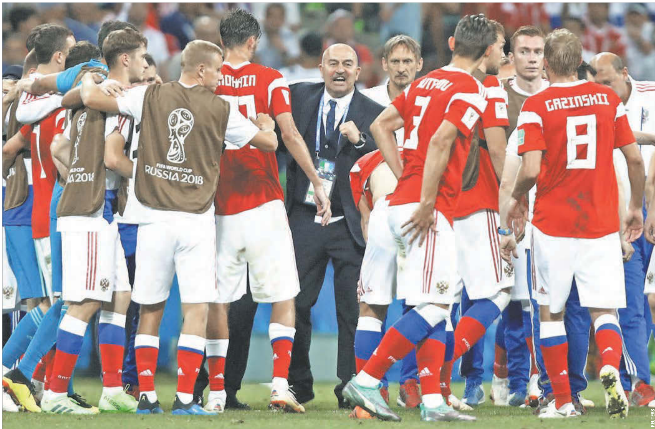
7 июля 2018 года. Сочи, Россия - Хорватия - 2:2 (пен. - 3:4). Главный тренер нашей сборной Станислав ЧЕРЧЕСОВ (в центре) настраивает игроков перед серией послематчевых пенальти в 1/4 финала чемпионата мира.

Эксклюзивное интервью главного тренера сборной России - о матчах с Сан-Марино (9:0) и Кипром (1:0), о чемпионате мира-2018 и возможных реформах российского футбола