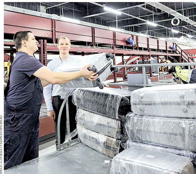
Оборудование нового терминала загрузили по полной.