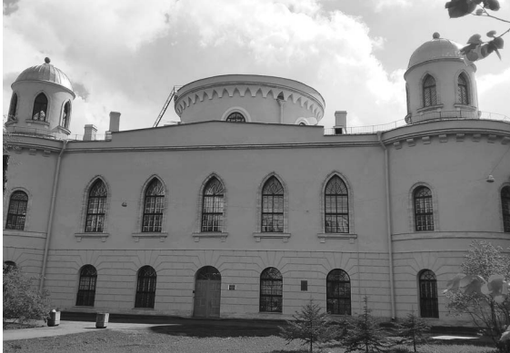
Во многих памятниках архитектуры, таких как Чесменский дворец, находятся вузы города. Вход для туристов туда закрыт.

Комитет по развитию туризма, подведомственное учреждение «Городское туристско-информационное бюро» и проект комитета по государственному контролю, использованию и охране памятников истории и культуры «Открытый город» создадут возможность для участия российских туристов в пешеходных экскурсиях с посещением «закрытых» объектов культурного наследия. Проект «Открытый город» работает в городе уже восемь лет и является уникальным для России. Профессиональные экскурсоводы разрабатывают маршруты с посещением объектов культурного наследия, которые не предназначены для повседневного показа гостям. Сегодня в арсенале «Открытого города» 150 памятников архитектуры, это бесплатные пешеходные и автомобильные экскурсии, а также маршруты для прогулок на велосипедах и самокатах. Совместно разработанные маршруты будут предложены российским туристам на сайтах Visit Petersburg и «Открытый город» в ближайшее время. Записаться на экскурсию можно посредством онлайн-регистрации из любого региона России.