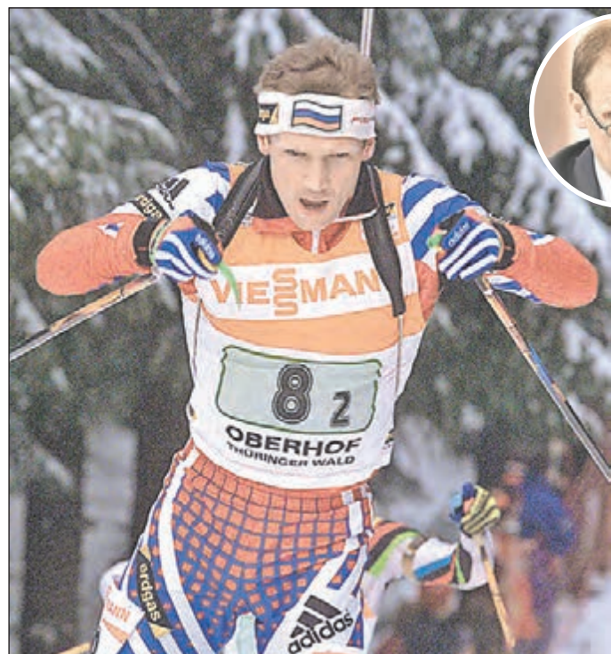
1999 год. Оберхоф. Владимир ДРАЧЕВ на этапе Кубка мира.

Новым президентом Союза биатлонистов России с большой долей вероятности станет четырехкратный чемпион мира Владимир Драчев