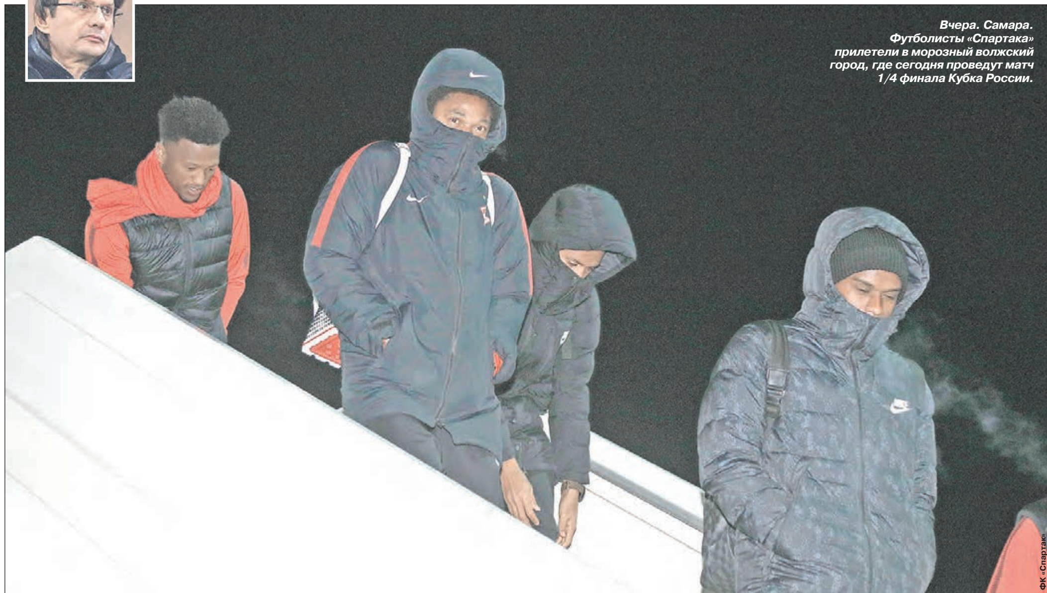
Вчера, Самара. Футболисты «Спартак» прилетели в морозный волжский город, где сегодня проведут матч 1/4 финала Кубка России.

Сегодняшний матч Кубка России между «Крыльями Советов» и «Спартак» из-за погодных условий находится в зоне риска. «СЭ» обратился за комментарием к владельцу красно-белых.