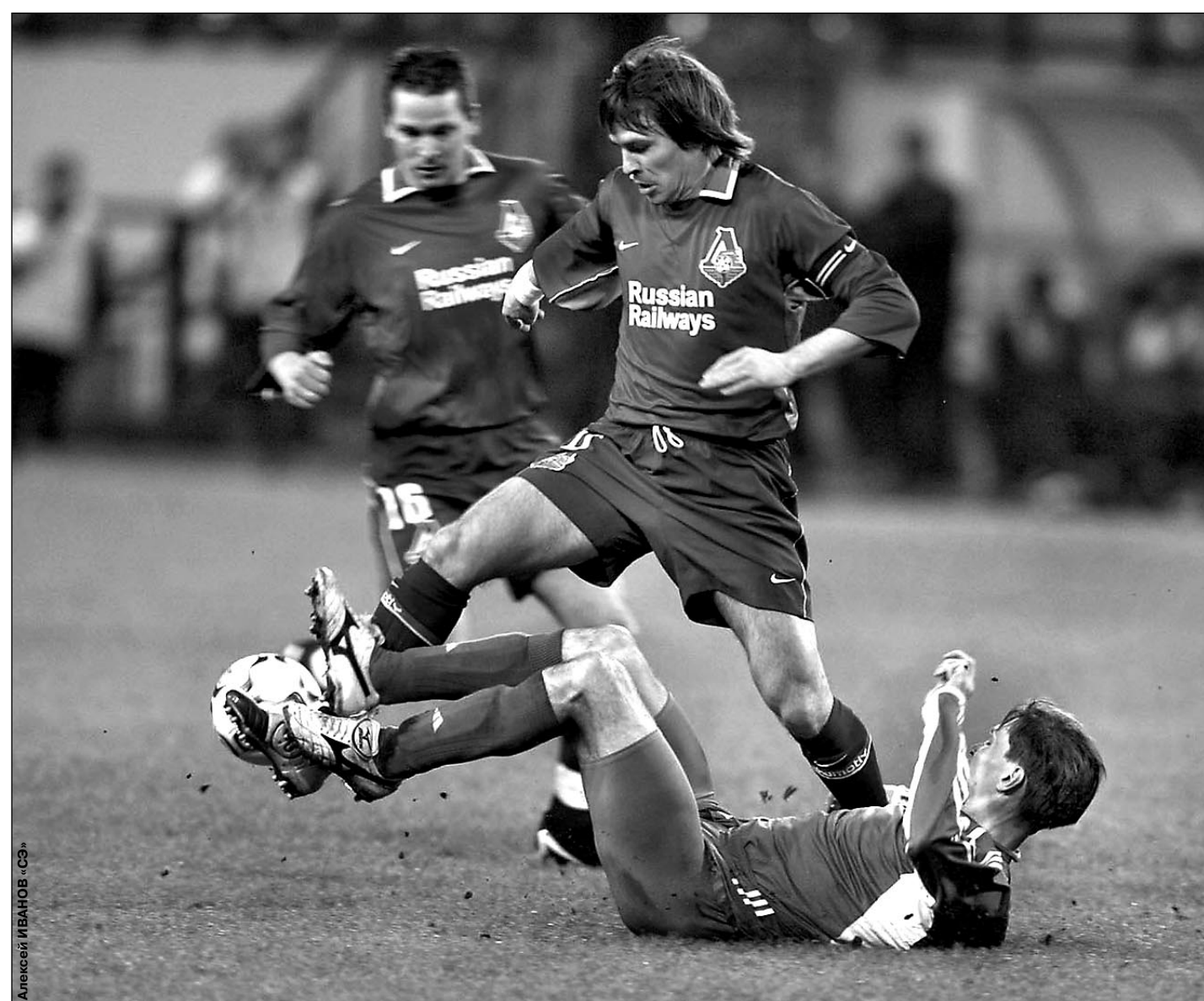
ЛИГА ЧЕМПИОНОВ. 1/4 финала. Первые матчи

Главным событием первого дня четвертьфиналов Лиги чемпионов стал разгром «Миланом» испанского «Депортиво» - 4:1. Победный гол в этой встрече и 38-й в Лиге чемпионов забил Андрей Шевченко. Благодаря ему украинский форвард обогнал нападающего «МЮ» Рууда ван Нистелроя и вышел на четвертое место в списке бомбардиров главного клубного турнира Европы всех времен.