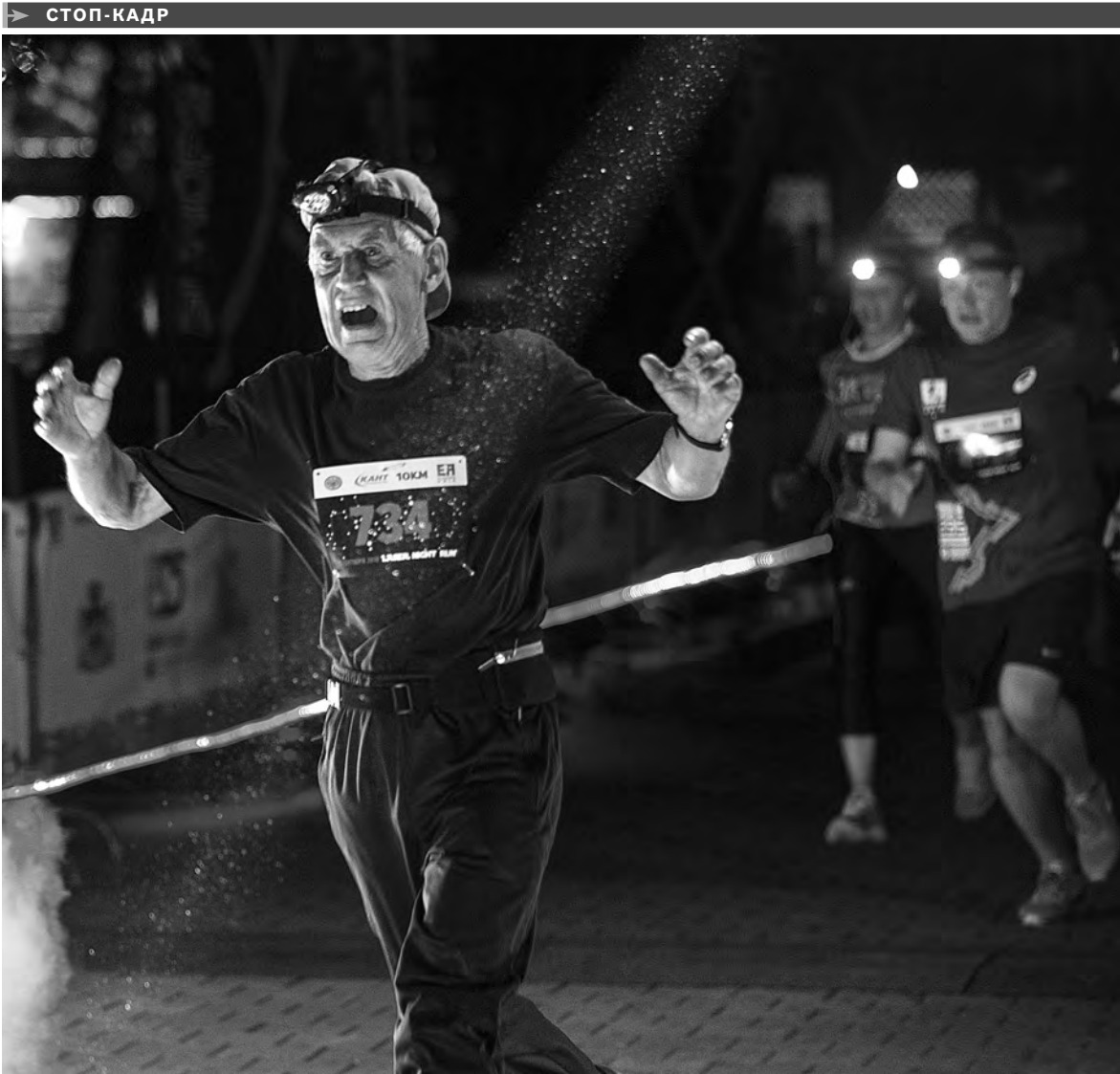
В минувшие выходные на Урале и в Западной Сибири бежали все. «Кросс нации» объединил десятки тысяч людей от мала до велика. А в Екатеринбурге вышли еще и на ночной забег по центральному парку отдыха. Здорово и красиво!