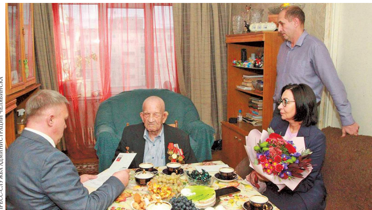
Ветерана в домашней обстановке поздравили глава Челябинска Наталья Котова и главный федеральный инспектор региона Денис Чернятьев.