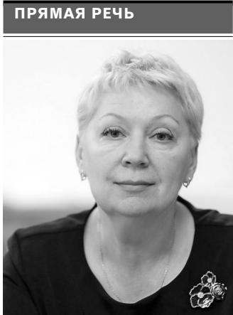
Ольга Васильева, министр просвещения РФ:

Кстати, за сто дней до мирового чемпионата в Екатеринбурге впервые прошли соревнования в профмастерстве для малышей—первый чемпионат рабочих профессий BabySkills. В нем приняли участие 30 детей из 25 детских садов Чкаловского района. В программе было семь компетенций, например, «Ресторанный сервис», «Инструктор по физической культуре», «Инженер-строитель». В практической части дошкольники сервировали стол, проводили зарядку, мастерили из конструкторов. Как отмечают инициаторы, чемпионат проводился для того, чтобы дать воспитанникам детских садов возможность познакомиться с разными профессиями и попробовать себя в них. ●