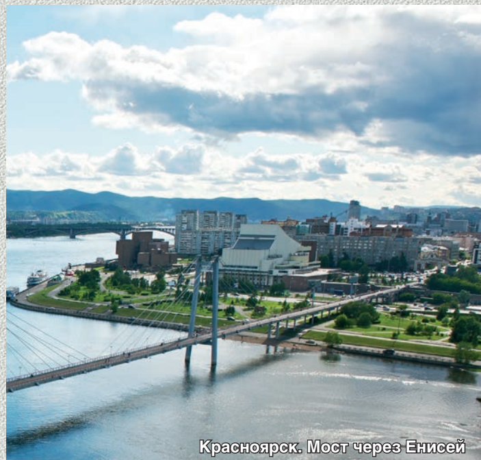
Красноярск. Мост через Енисей