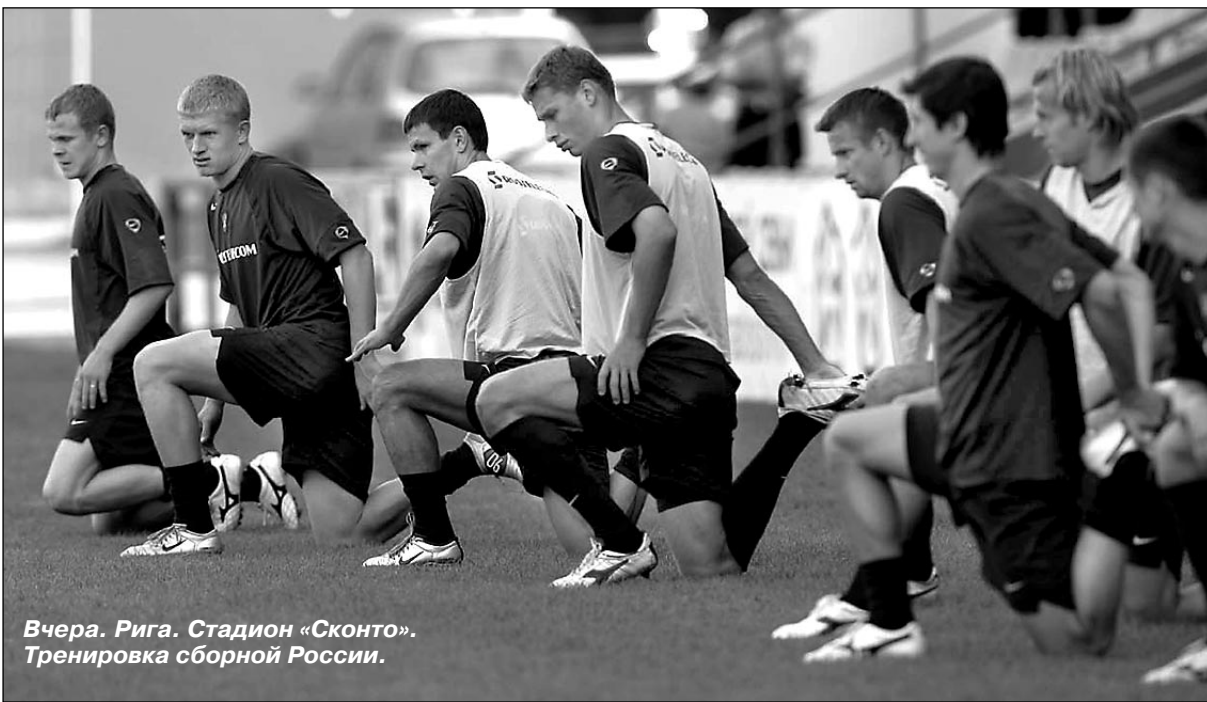
Вчера. Рига. Стадион «Сконто». Тренировка сборной России.