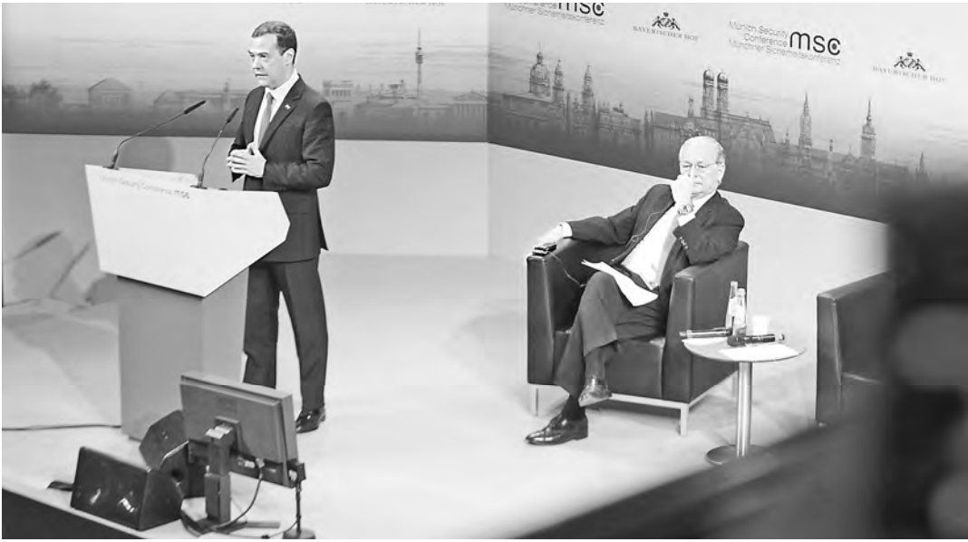
Дмитрий Медведев на конференции в Мюнхене предложил Западу отказаться от политического противостояния.

Официальные курсы валют ЦБ России с 13.02.16