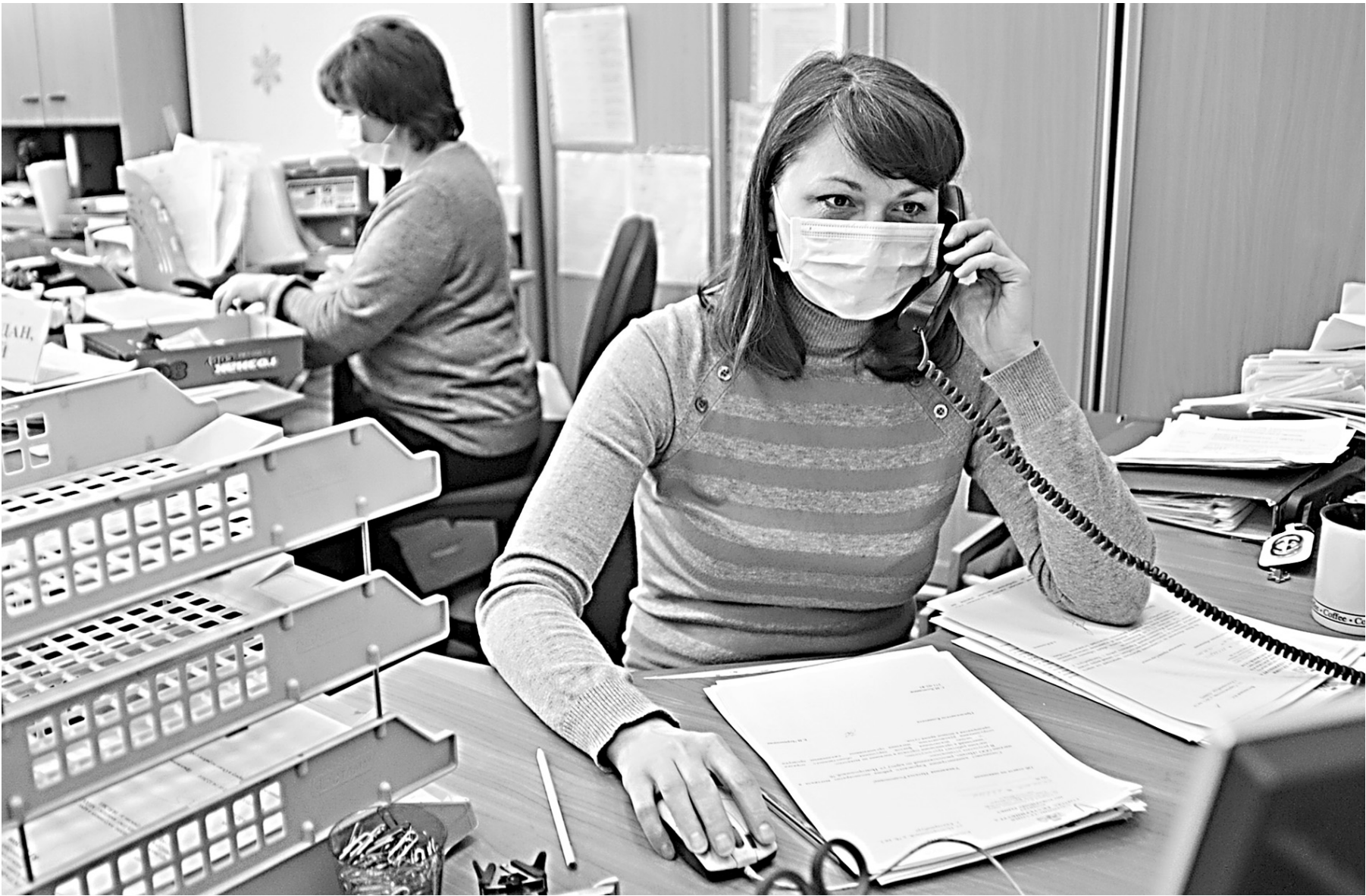
АНОП ВЕЛИЧКО / РАС