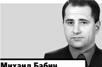
Михаил Бабич, полпред президента РФ в ПФО