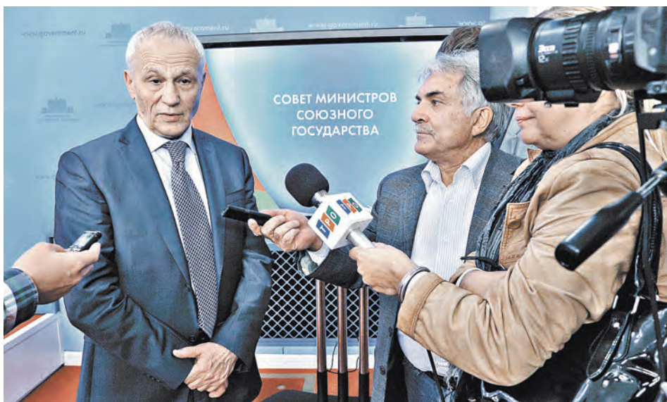
После завершения заседания Госсекретарь Союзного государства Григорий Рапота еще полчасы отвечал на вопросы журналистов.