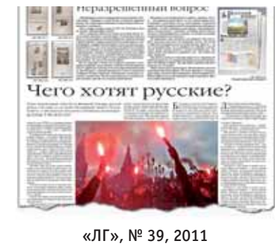
«ЛГ», № 39, 2011