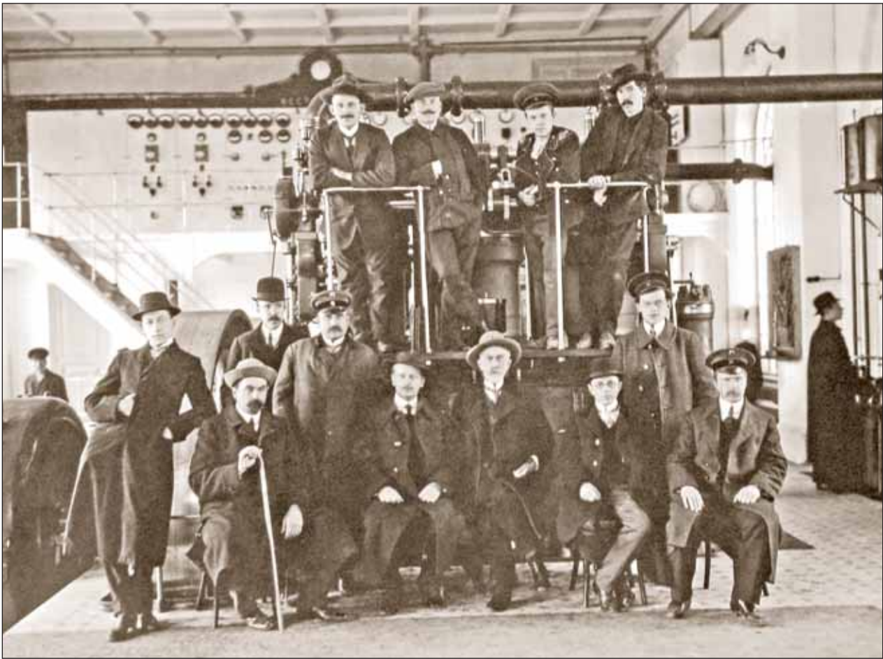
В машинном зале Рязанской городской электрической станции в день её открытия. Рязань. 1913 год. Когда-то в России строили не только торговые центры с заграничными товарами...

циональность. Идея чем-то похожа на нынешнее шведское безумие: преобразователи мира замахнулись на саму природу, которая создала пол и народы. В ближайшем будущем «отменить» эти две сущности, скорее всего, не получится. Так что бороться с ними – безнадежно. А вот советская власть пробовала. Результат известен.