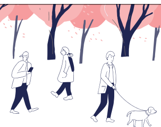
Рисунок на обложке: Shutterstock.com

ПРИЗ ЗА ПОДПИСКУ 10 подарков для ПЕРВЫХ ПОДПИСАВШИХСЯ В МАЕ