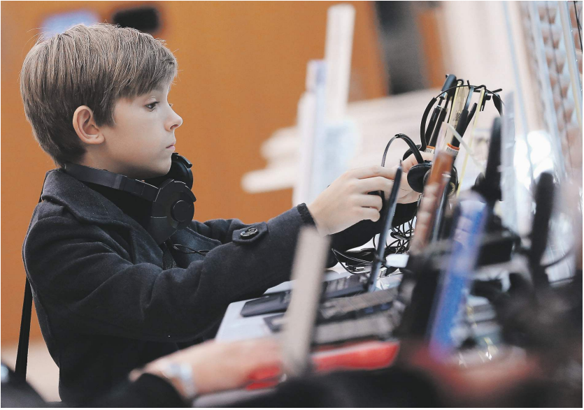
Алена Невзорова / ТАСС