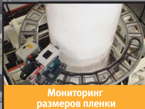
Мониторинг размеров пленки