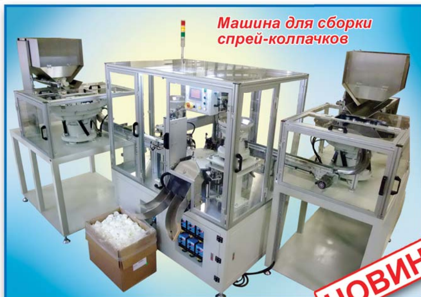
Машина для сборки спрей-колпачков