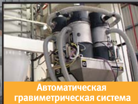
Автоматическая гравиметрическая система