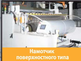
Намотчик поверхностного типа