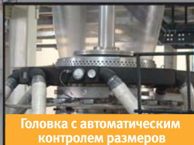
Головка с автоматическим контролем размеров