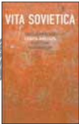
Vita Sovietica. Неакадемический словарь-инвентарь советской цивилизации / Под ред. А.Лебедева. М.: Август, 2012. – 296 с.

1 Всем желающим интеллигентно отметить 20-летие распада СССР наверняка пригодится этот сборник эссе. 14 авторов – писателей, ученых-гуманитариев, критиков – вспоминают и осмысливают реалии советской цивилизации: от сурово-материальных, вроде трехрублевой бумажки и «жевачки», до фирменного советского хамства и бровей как символа.