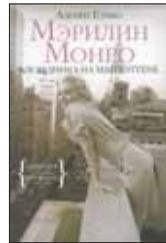
Гомбо А. Мэрилин Монро. Блондинка на Манхэттене / Пер. с фр. Е.Головиной. М.: Колибри, Азбука-Аттикус, 2012. — 176 с.: ил. — (Серия «Персона»).

7 В отличие от Мэрилин Монро, Энди Файнгерш нуждается в представлении. Нью-йоркский фоторепортер, прозванный «метеором» и «гением „без царя в голове“», снимал под водой и в воздухе. А в 1955 году он сделал ту серию фотографий, которой суждено было стать иллюстрацией целой эпохи: там запечатлена Мэрилин. Об этой «эпохе» и рассказывает Адриен Гомбо.