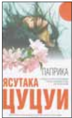
Цуцуи Я. Паприка / Пер. с яп. А.Замилова. М.: Эксмо, 2012. – 384 с.