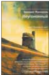
Манкелль Х. Неугомонный / Пер. со швед. Н.Федоровой. М.: Иностранка, 2012. — 608 с. — (Лекарство от скуки).

4 Зимним днем во время прогулки в лесу бесследно исчезает пенсионер, в прошлом морской офицер высокого ранга, Хокан фон Энке, а следом — его жена. Для комиссара полиции Курта Валландера это дело оказывается еще и личным: пропавшие — свекор и свекровь его дочери Линды. Запутанные нити, похоже, ведут в прошлое, в эпоху холодной войны.