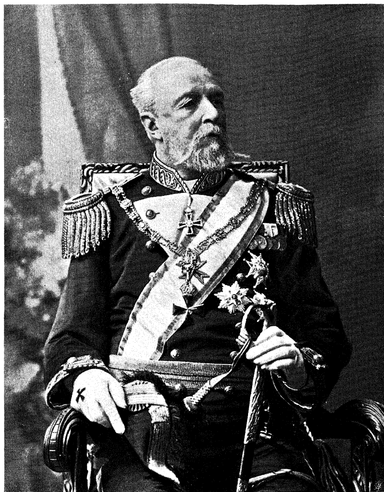
OSCAR II SVERIGES OCH NORGES KONUNG