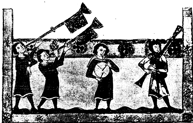
TROMPETTES, TAMBOURIN, BOMBARDE (xiii e siècle. — Ms. des Minnesinger).