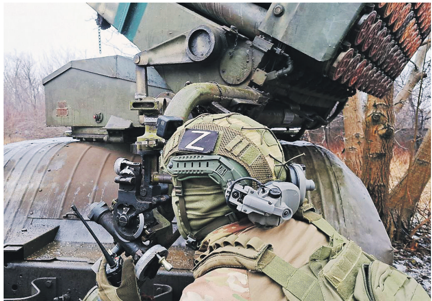
Дмитрий Астахов / Известия

Восстановление центральной роли Швейцарии в мирном диалоге мне кажется чрезвычайно важным.