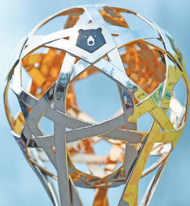
Дарья Исаева «СЗ». Снято на Сапоне