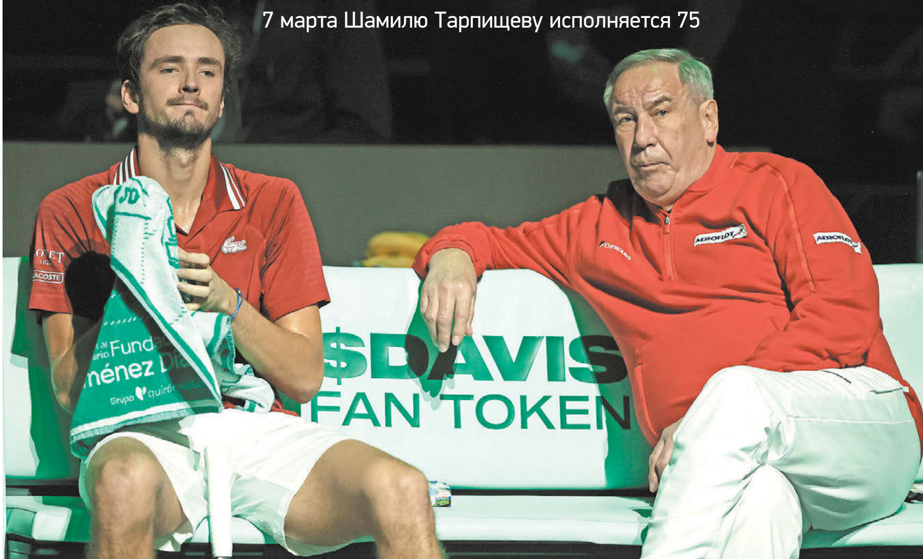
Даниил Медведев и Шамиль Тарпищев