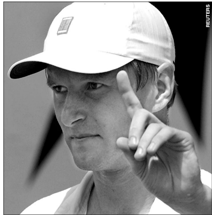
Вчера. Париж. Евгений КАФЕЛЬНИКОВ.