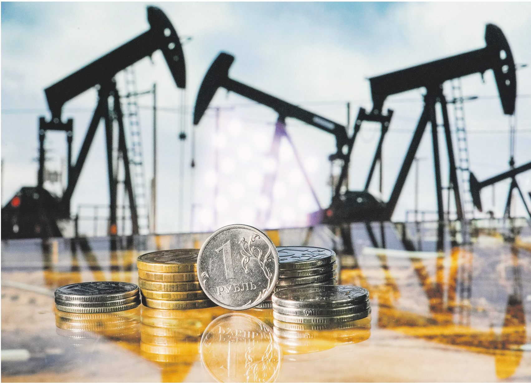
Сергей Паников / Известия