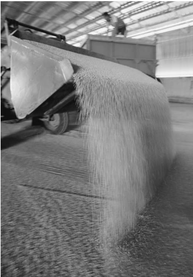
Зерно опять может стать «резервной валютой»

DJIA 13170.19 ▼ NASDAQ 3074.15 ▼ MB5 1560.75 ▲ PTC 1698.18 ▲ НЕФТЬ BRENT 124.45 ▲ ЗОЛОТО 1653.94 ▲ €/РУБЛЬ 38.76 ▲ $/РУБЛЬ 29.21 ▲