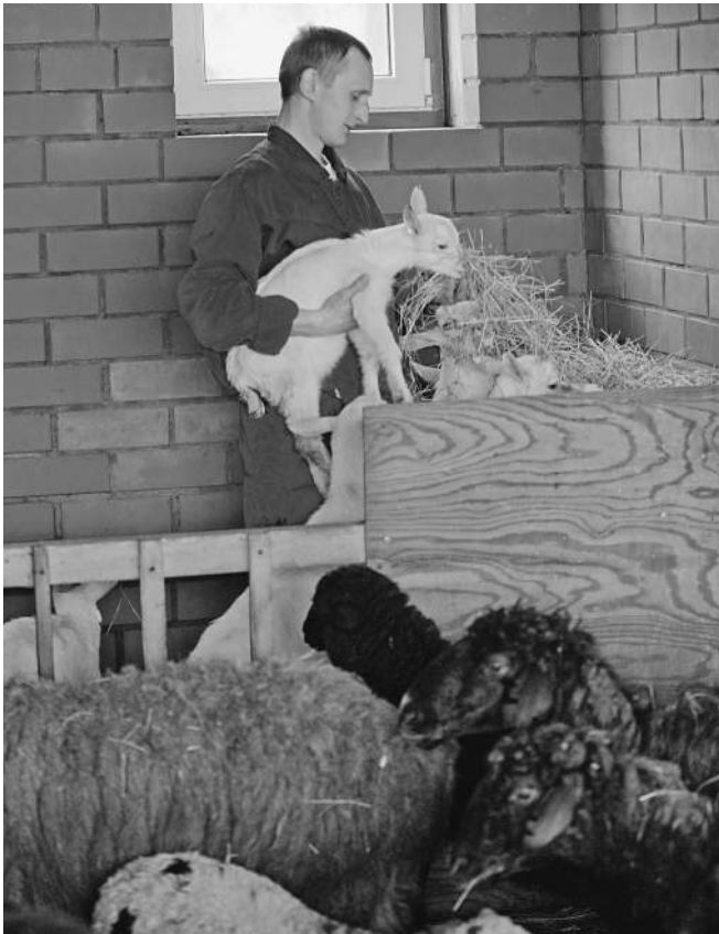
Развитие сельского хозяйства — долгий процесс

— Программа согласована со всеми министерствами и ведомствами, остались разногласия