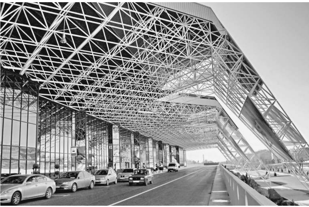
Основной терминал сочинского аэропорта уже стал одной из визитных карточек города