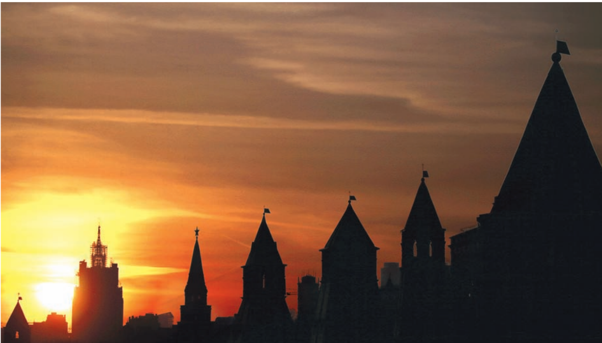
Солнце встает не над одним Кремлем, но и над российским финансовым рынком.