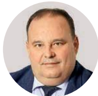
С. Е. Прокофьев Ректор Финансового университета при Правительстве РФ