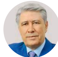
М. А. Эскиндаров Президент Финансового университета при Правительстве РФ