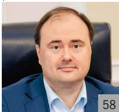
А. В. МОЛЧАНОВ, мэр города Ярославля