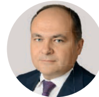
Л. В. Горнин Первый заместитель министра обороны РФ