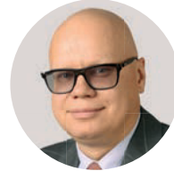
А. М. Лавров Заместитель министра финансов РФ