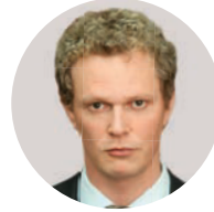
Д. В. Егоров Руководитель Федеральной налоговой службы