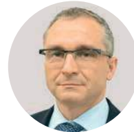
Д. В. Вольвач Заместитель министра экономического развития РФ