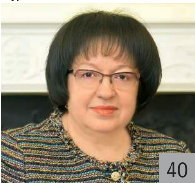
В. И. АДДЕЕВА, министр финансов Калужской области