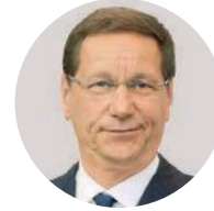
А. Д. Жуков Первый заместитель председателя Государственной Думы