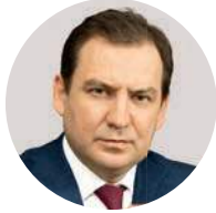
Е. А. Данчиков Министр Правительства Москвы, начальник Главной контрольной управления города Москвы