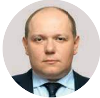
В. А. Зеленский Первый заместитель министра здравоохранения РФ