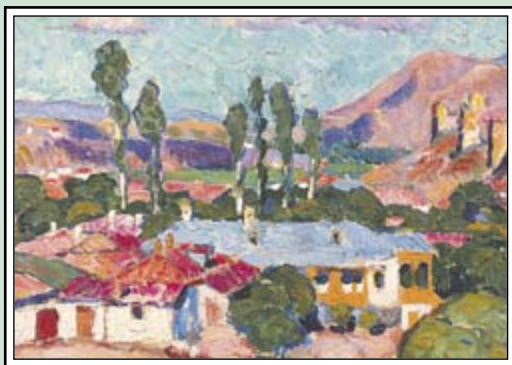
И. Машков Крымский пейзаж. Судак 1920-е гг.