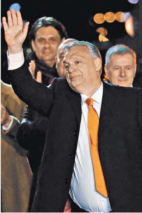
Сербия однозначно поддержала сбалансированный курс Александра Вучича (слева), который не продает их интересы ради благ евроинтеграции. Жители Венгрии также высоко оценили здоровый национализм Виктора Орбана (справа).